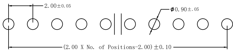
Recommended PCB Layout

弯曲度: 1*02P ~ 1*20P 0.30 MAX. 1*21P ~ 1*30P 0.40 MAX. 1*31P ~ 1*40P 0.50 MAX.